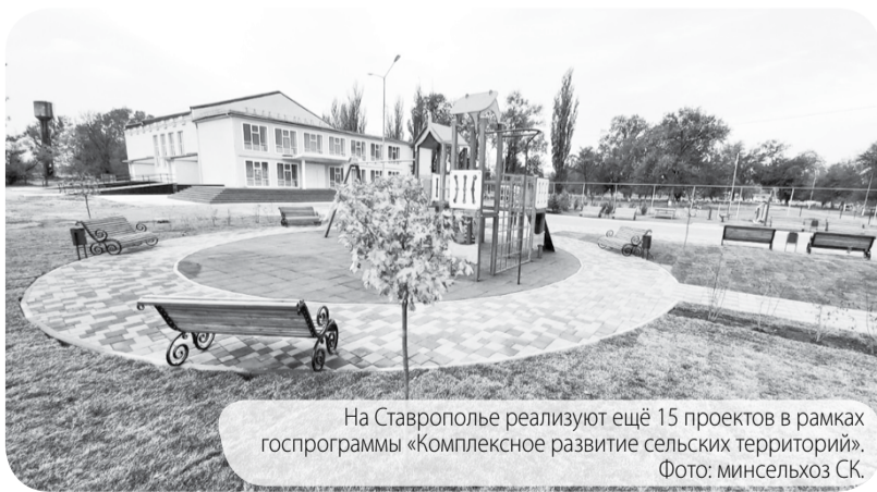
На Ставрополье реализуют ещё 15 проектов в рамках госпрограммы «Комплексное развитие сельских территорий».

За последние годы реализации регпрограммы капитально отремонтированы 18 учреждений