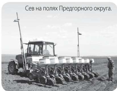
Сев на полях Предгорного округа.

Завершён первый круг внесения азотных удобрений на поля озимых. Сейчас проходит их химическая обработка, выполнено 1500 га из 36000 га плана.